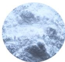
WHITE Crystal Powder